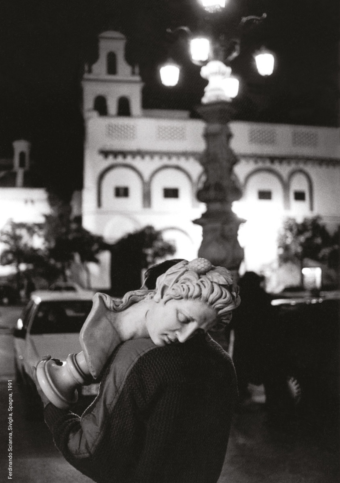
Siviglia, Spagna, 1991